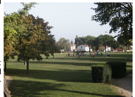
Stade de Pichery